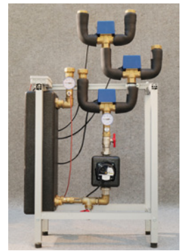
Einbindung über einen Wärmetauscher.