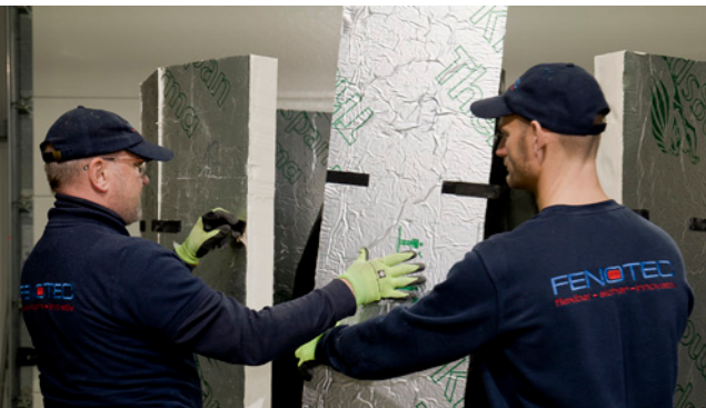
Das Stecksystem ermöglicht fast jede Größe.