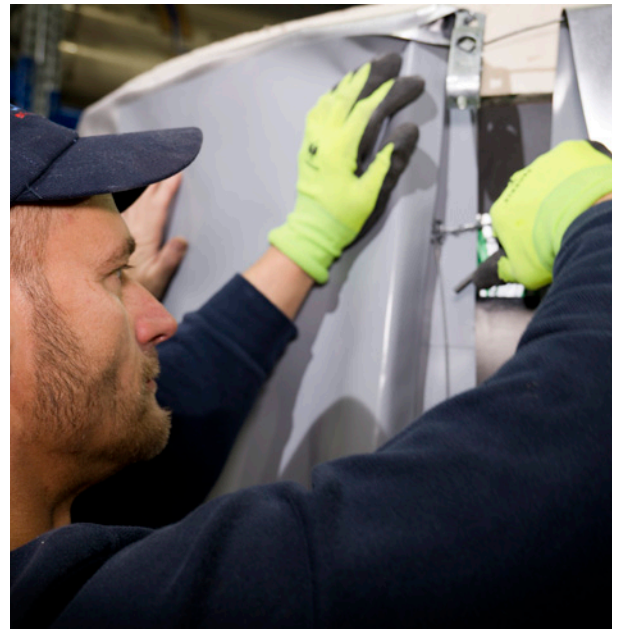
Leichter Aufbau des "VARIO": Das benötigte Werkzeug besteht nur aus Maulschlüssel und Akkuschauber!