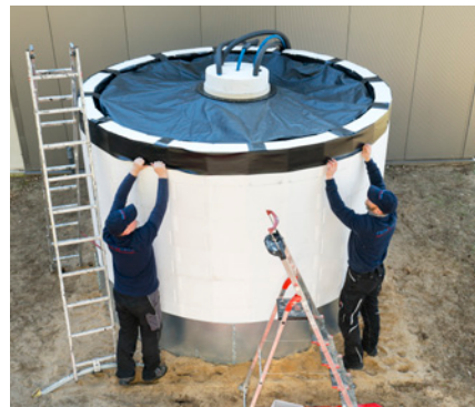
Schnell und einfach aufzubauen.